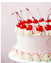
Denise Hélène Vultier Eltschinger